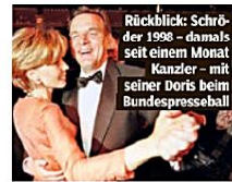
Rückblick! Schröder 1998 - damals seit einem Monat Kanzler - mit seiner Doris beim Bundespresseball

Natürlich kam Kanzlerin Angela Merkel nicht, das hat ja Tradition, dafür lieferte Vorgänger Gerhard mit Ehefrau So-yeon Kim eine fulminante Schröder-Show. Auch Ex-Gattin Doris düste mit ihrem jetzigen Lebensgefährten Boris Pistorius über die A 2 aus Hannover ins Berliner Luxushotel „Adlon“. Den Dinnersaal betrat sie eine Stunde nach dem Altkanzler, beim Eröffnungswalzer war sie früher kampf-, äh, tanzbereit. Vor dem Duell folgte aber selbstredend noch ein kleines Aufwärmprogramm. „Auf viele Gäste hier freue ich mich, auf manche nicht“, stellte Doris klar. „Ein Treffen mit meinem Ex strebe ich nicht an.“ Und wenn es doch dazu kommt? „Die Auseinandersetzung, die wir haben, führen wir vor Gericht und nicht im Ballsaal.“ Oha, wir erinnern uns: