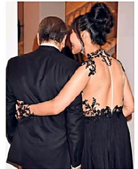
Entzückender Rücken! Mit ihrem offenherzigen Kleid sorgte Schröder-Kim für Aufsehen